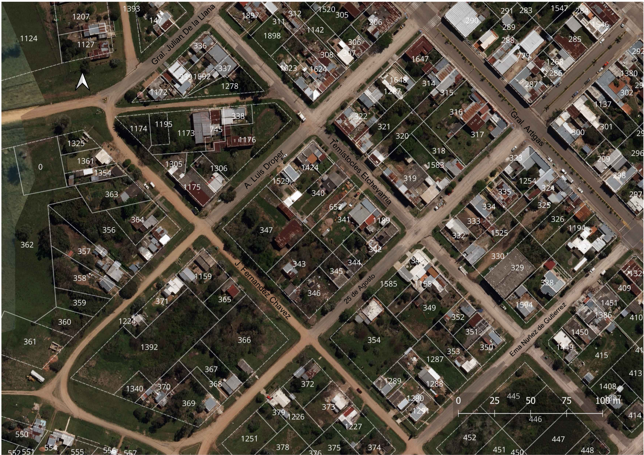
FOTO ÁEREA ESC 1_1500