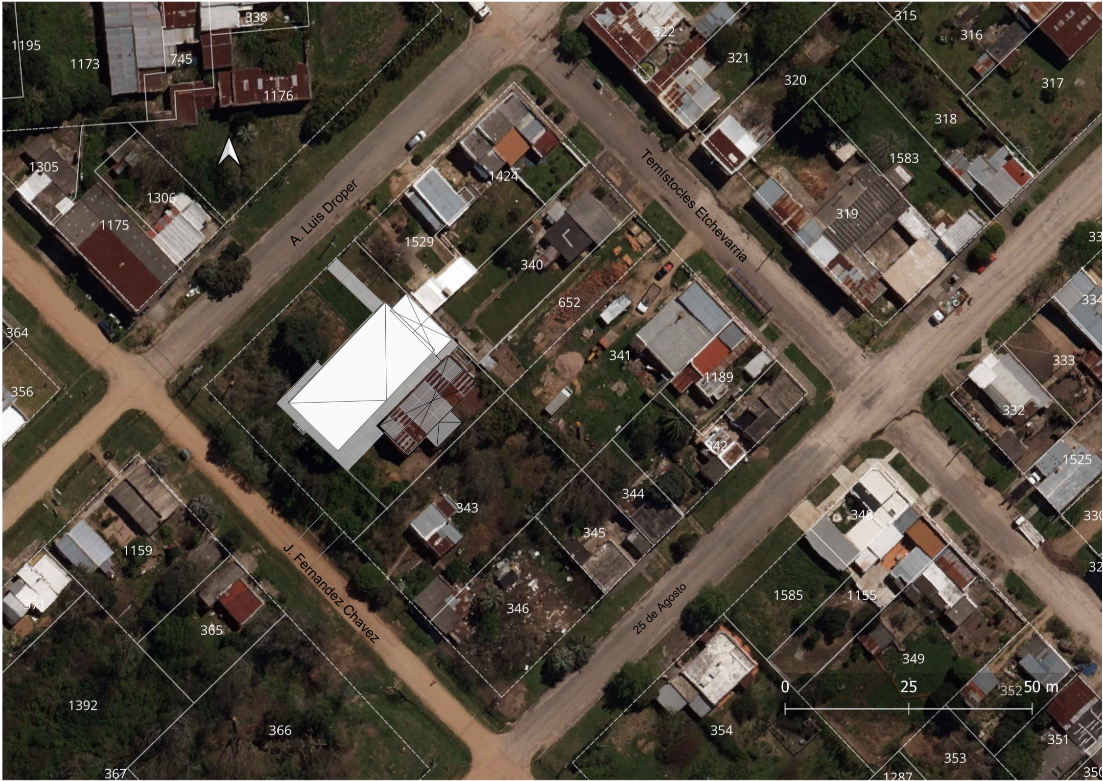
FOTO ÁEREA ESC 1_750